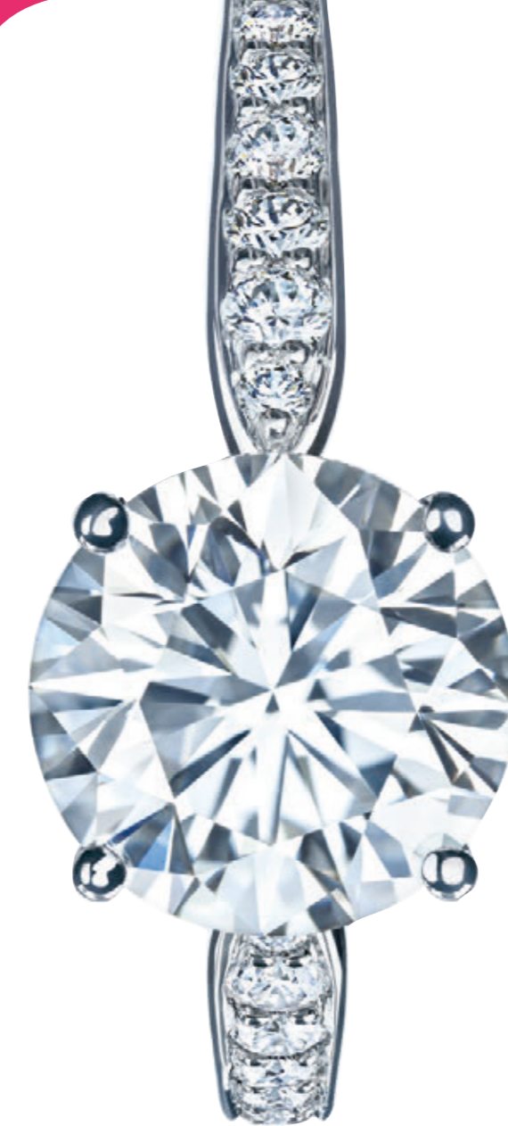
Тiffany Harmony™ из платины, с ободком, украшенным бусинами.