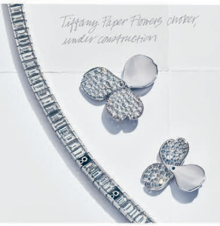
Tiffany Paper Flowers choker, under construction