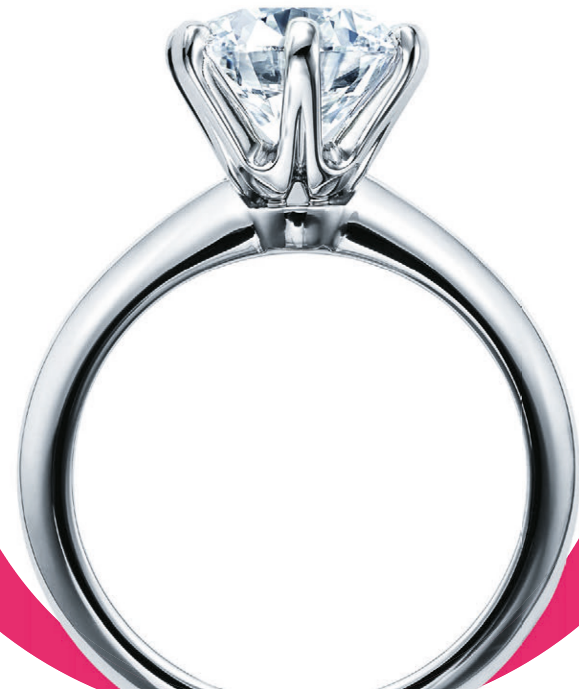
Тiffany® Setting из платины.