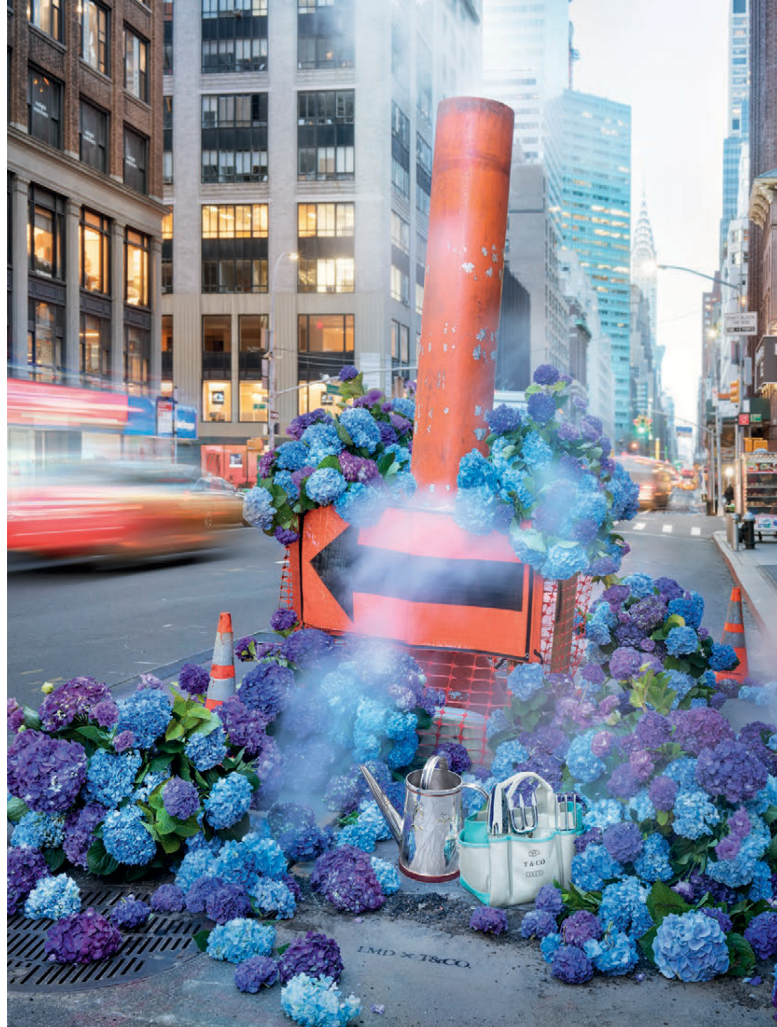
На противоположной странице: Садовая сумка из парусины. Лейка из стерлингового серебра с ирисами.