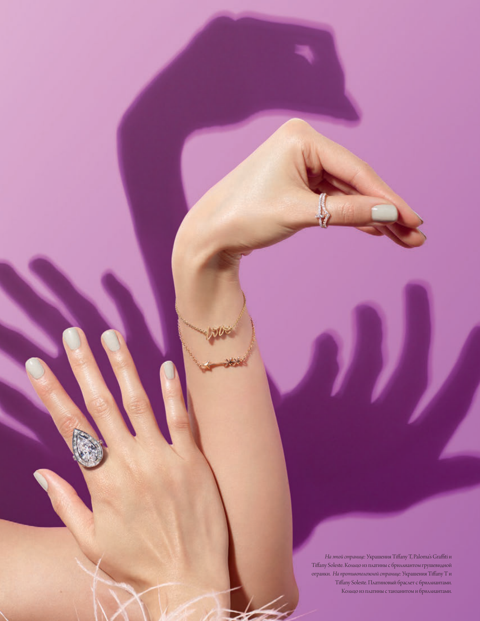
На этой странице: Украшения Tiffany T, Paloma's Graffiti и Tiffany Soleste. Кольцо из платины с бриллиантом грушевидной огранки. На противоположной странице: Украшения Tiffany T и Tiffany Soleste. Платиновый браслет с бриллиантами. Кольцо из платины с танзанитом и бриллиантами.