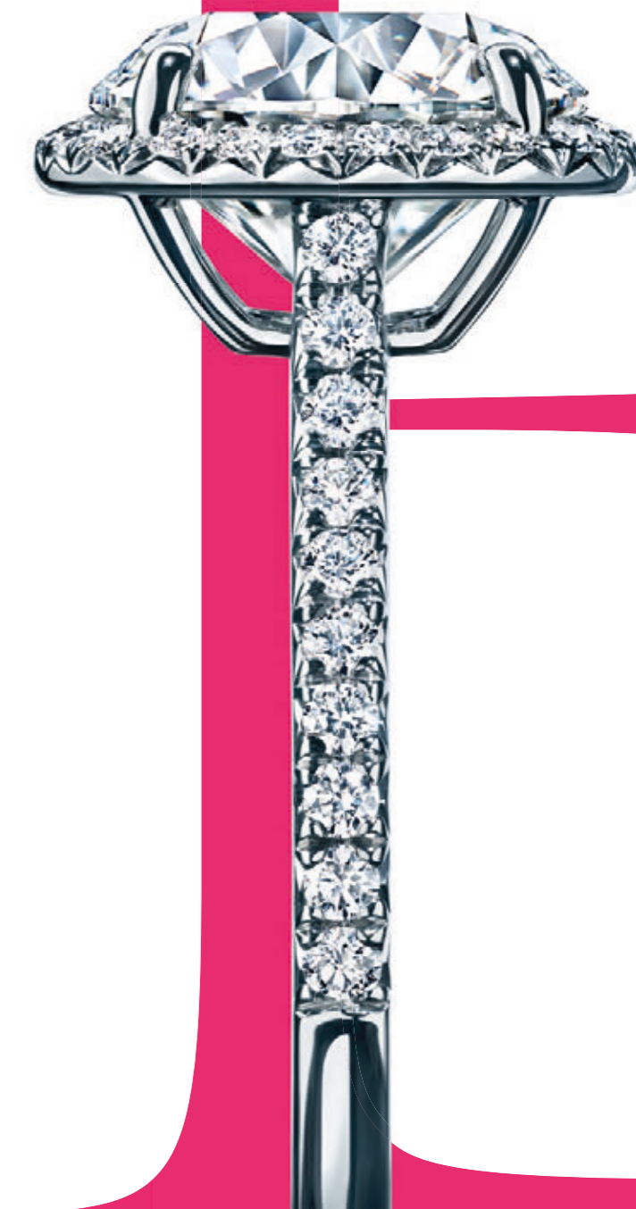
Кольцо Tiffany Soleste с круглым бриллиантом из платины с бриллиантами.