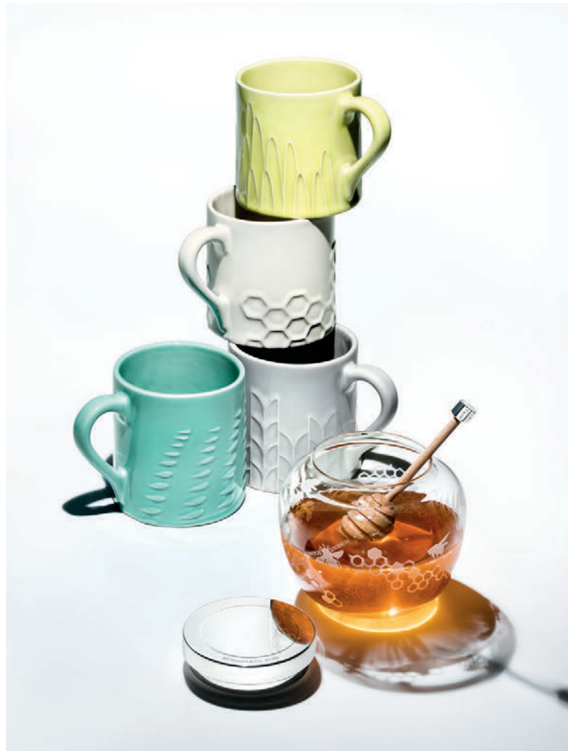
На этой странице: Украшения Flora & Fauna.