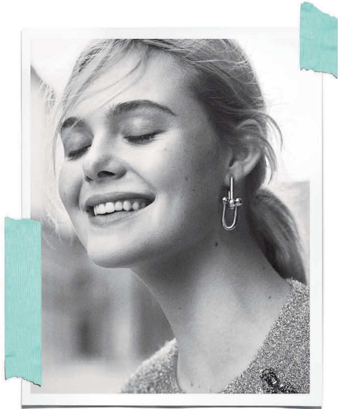
На предыдущем развороте: Украшения Tiffany Paper Flowers из платины с бриллиантами. На этом развороте: Украшения Tiffany HardWear и Ziegfeld. Браслет с разъемными звеньями.