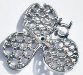
Platinum settings for diamond, sapphire and tanzanite earrings during assembly