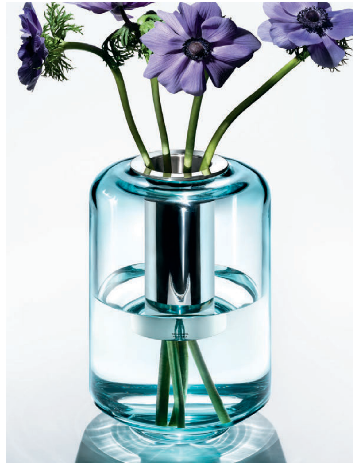
На предыдущей странице: Цветочные горшки из стерлингового серебра. На противоположной странице: Сумка на выходные из парусины. Терракотовые цветочные горшки. Сплетенное из нитей стерлингового серебра гнездо с фарфоровыми яйцами Tiffany Blue®. На этой странице: Ваза Seguso Vetri D'Arte из стекла и стерлингового серебра. Отдельные изделия коллекции «Дом и аксессуары», представленные в этой истории, появятся в продаже летом 2018 г.