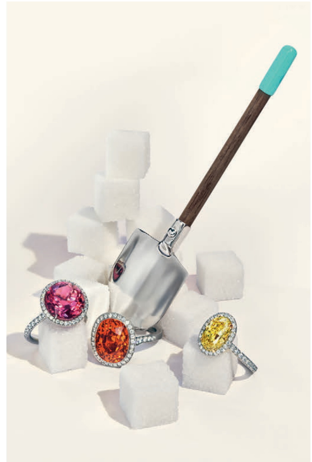
На предыдущем развороте: Кольцо Tiffany Paper Flowers из платины с бриллиантами. На этом развороте: Комплект из трех предметов Tiffany Blue®, костяной фарфор. Серьги из платины с бриллиантами. Лопатка для сахара из стерлингового серебра и черного ореха. Кольца из платины с драгоценными камнями и бриллиантами, слева: розовый турмалин, спессарит и фантазийный ярко-желтый бриллиант. Отдельные предметы коллекции «Дом и аксессуары», представленные в этой истории, появятся в продаже летом 2018 г. Коллекция Tiffany Paper Flowers будет представлена в избранных магазинах уже летом, а по всему миру – начиная с 1 сентября. Чтобы узнать больше, пожалуйста, обратитесь в клиентскую службу или посетите Tiffany.com .