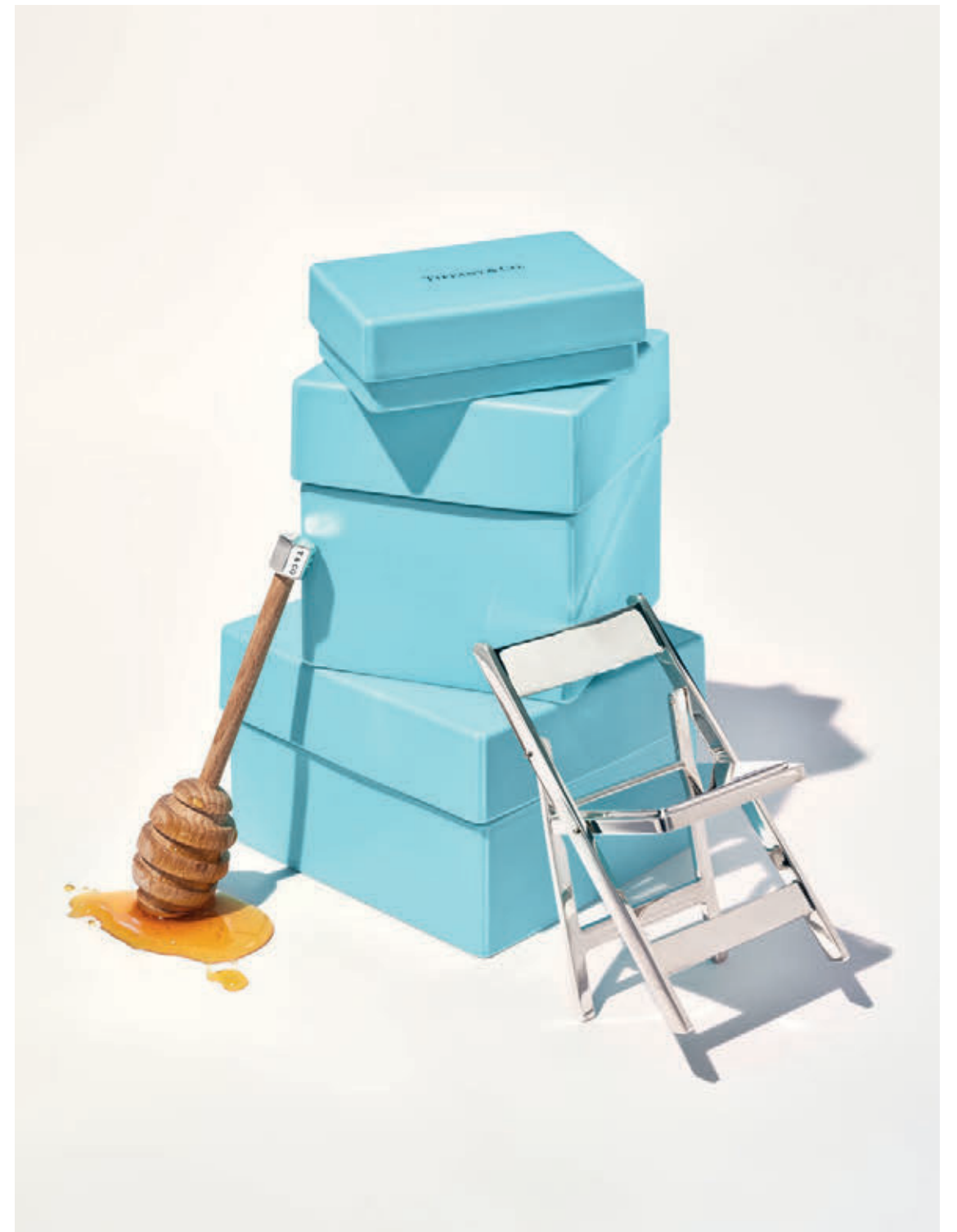
На противоположной странице: Прищепка из стерлингового серебра. Колье Tiffany Paper Flowers из платины с бриллиантами и танзанитами. На этой странице: Изделия коллекции «Дом и аксессуары».